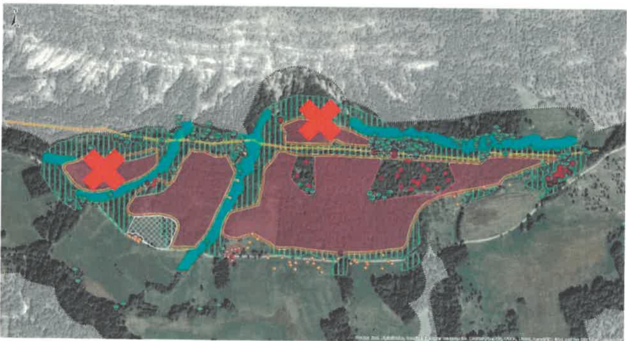
Plan d'aménagement du parc photovoltaïque

Afin d'éviter tout impact brut sur l'Orchis de Spitzel et de réduire au maximum les impacts sur les chiroptères, le Maître d'ouvrage réduit l'emprise initiale de son projet en supprimant les zones Nord et Ouest, conformément au plan d'implantation de la centrale ci-dessous.